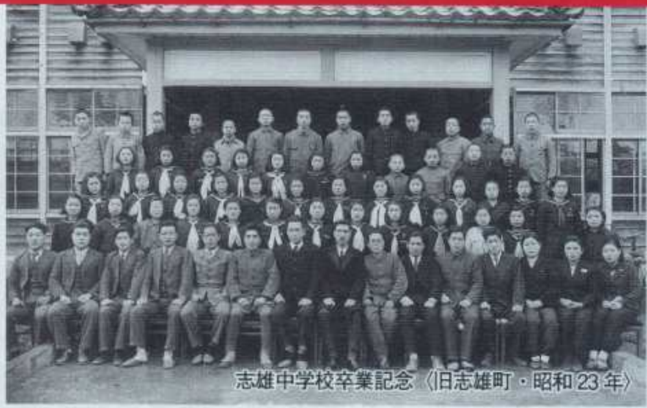
志雄中学校卒業記念 〈旧志雄町・昭和23年〉