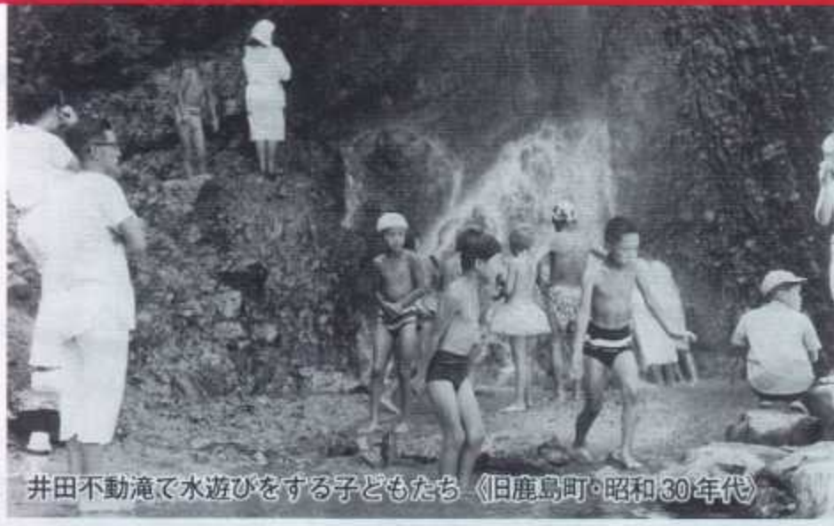
井田不動滝で水遊びをする子どもたち 〈旧鹿島町・昭和30年代〉