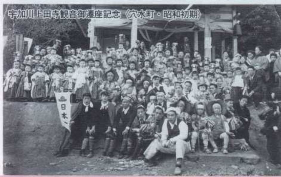
宇加川上田寺観音御遷座記念 〈穴水町・昭和初期〉